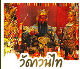
วัดกวนี่ไท