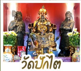
วัดป๊กโต