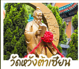
วัดแว้งต้าเซีงน