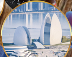
โรงแรมหรูไฮ้มุก