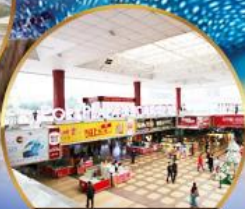
ตลาดกังเป๋ย