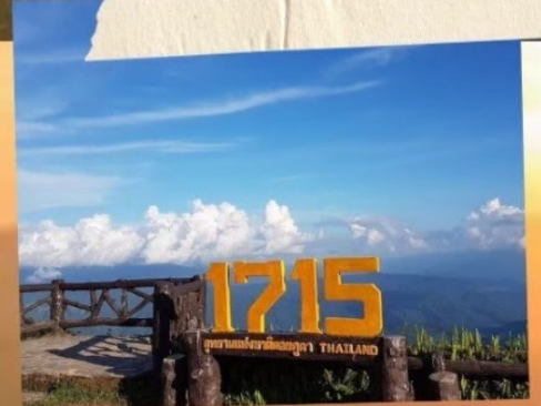
จุดชมวิว 1715