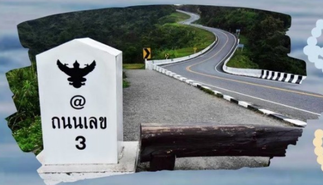
ถนนหมายเลข 3