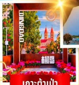
เกาะต้าเป่า