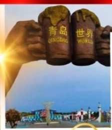
สถานที่จัดงานเทศกาล เบียร์ชิงเต่า