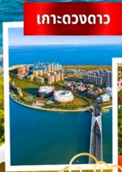
เกาะดวงดาว