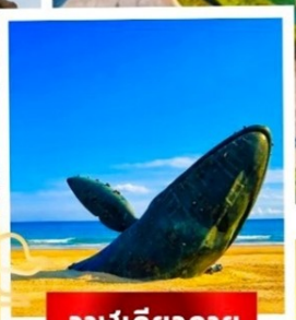
วาฬเดี่ยวตาย