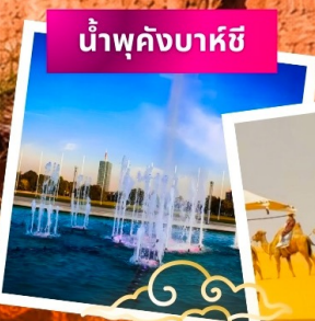
น้ำพุคังบาหีซี