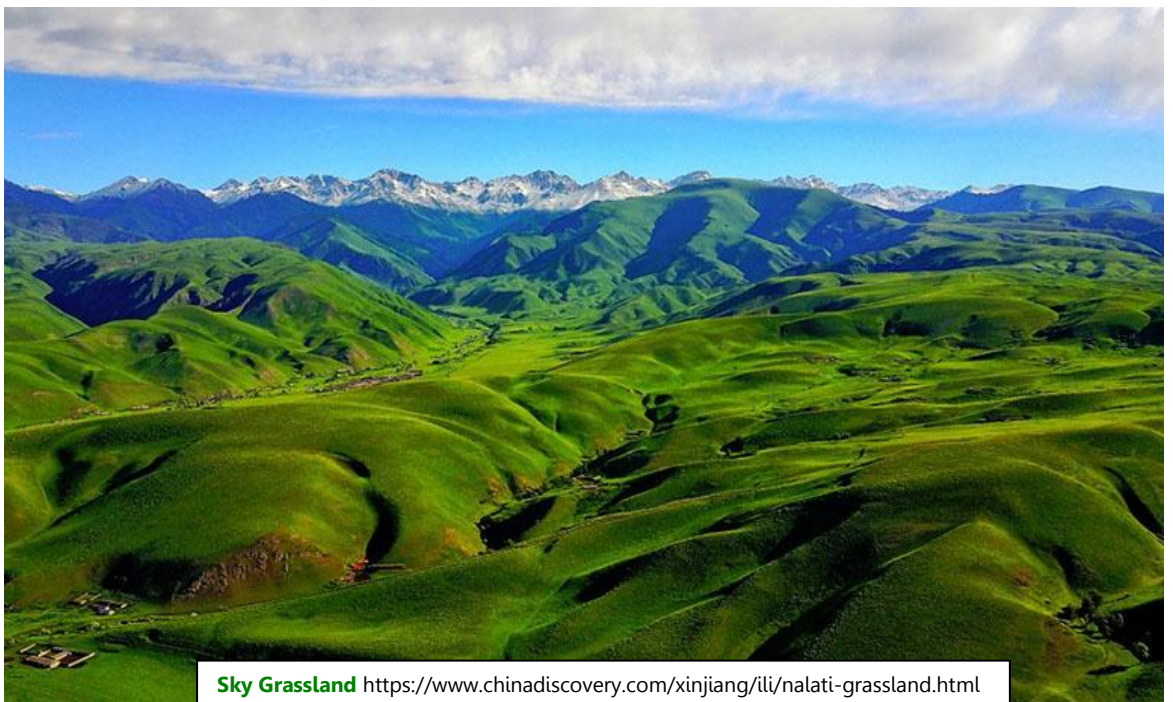
Sky Grassland https://www.chinadiscovery.com/xinjiang/ili/nalati-grassland.html