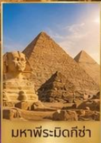
มหาพีระมิดกิซ่า