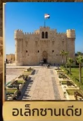
อเล็กซานเดีย