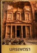
นคสเวตรา