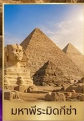
มหาพีระมิดกิซ่า