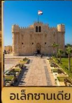
อเล็กซานเดีย