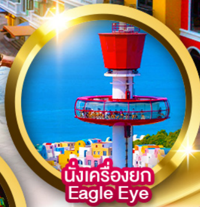
นั่งเครื่องยก Eagle Eye