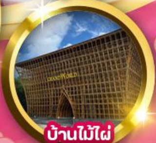
บ้านไม้ไฟ