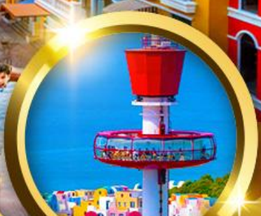
นั้งเครื่องยก Eagle Eye

"เวนิสแห่งเอเชีย" Grand World Phu Quoc สถาปัตยกรรมสไตล์ยุโรปหลากสีสัน