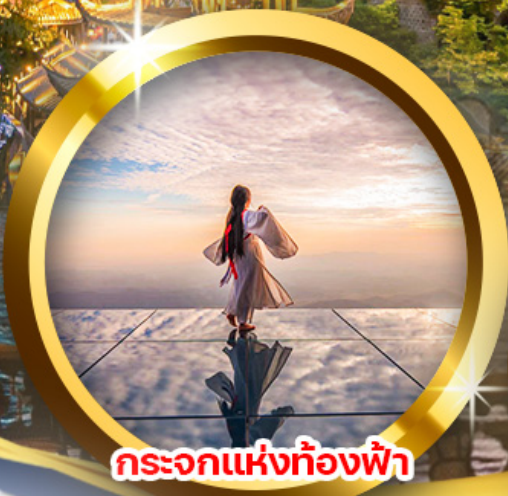
กระบอกแห่งท้องฟ้า