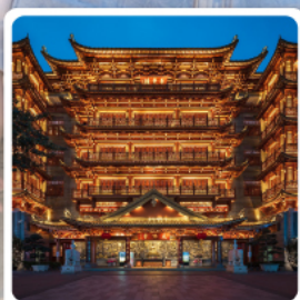
วัดต้าฝื่อซื่อ