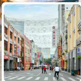
ถนนคนเดินเป่ย์จิงตุ๋