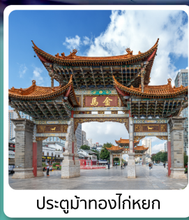
ประตูม้าทองไค่หยก