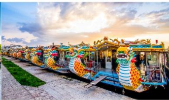
ล่องเรือมังกร