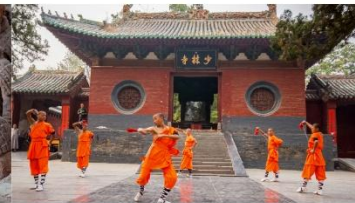
ชมโชว์กังฟูเล่าหลิน

*ทางบริษัทฯ ขอสงวนสิทธิ์ในการสลับโปรแกรมทัวร์ตามความเหมาะสมขึ้นอยู่กับสถานการณ์หน้างาน โดยคำนึงถึงผลประโยชน์ของลูกค้าเป็นสำคัญ