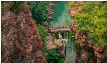
อุทยานสวรรค์หยุนโกซาน