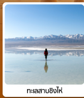
ทะเลสาบซิงไห่