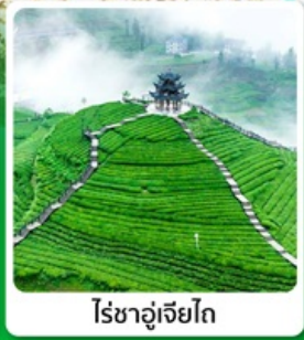
ไร่ชาอู่เจียโต