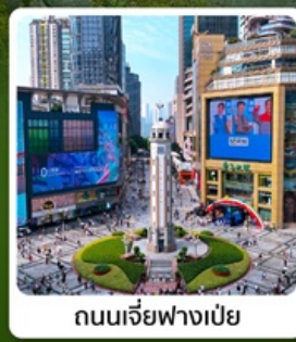
ถนนเจี๋ยฟางเป่ย์