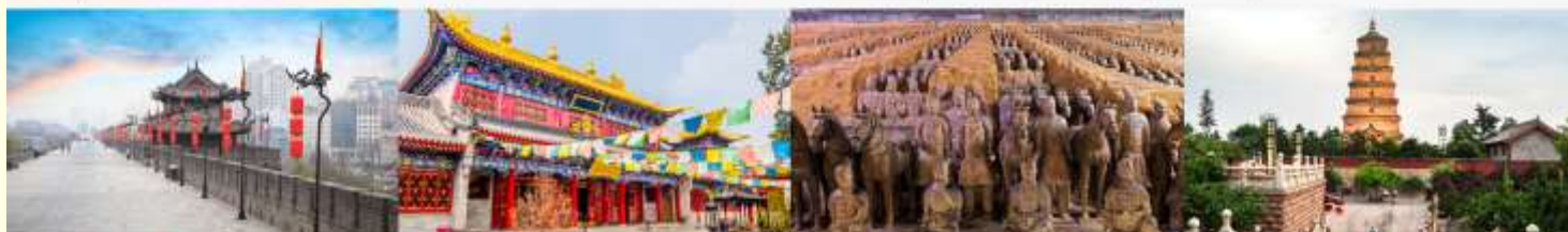
กำแพงเมืองโบราณ