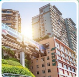
รถไฟฟ้าทะลุถ้ำ