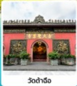
วัดจำจ้อ