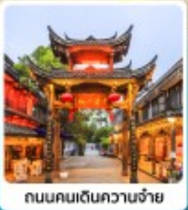
ถนนคนเดินควานจั๊ย

• ไอลี่ หุบเขาของเจียวโกว สวรรค์บนดิน ณ กุเขาสีดรุณี วัดจำจ้อ วัดหามตตา ใจกลางนครเจิงตู