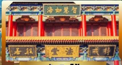
วัดจินไท่