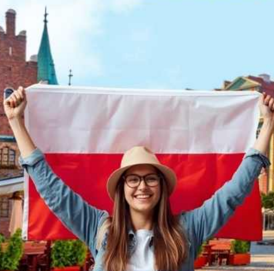
เที่ยวเมืองเกลือ

เล่นที่เมืองเก่าแห่งโปแลนด์ เที่ยวครบไฮไลท์ 9 วัน 6 คืน