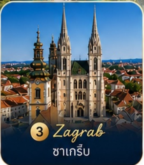
3 Zagreb ซาเกร็บ