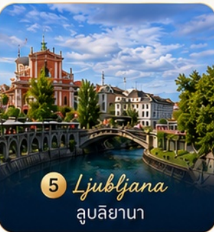
5 Ljubljana ลูบลียานา