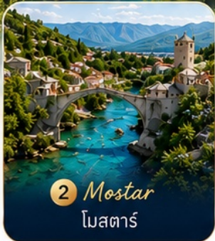
2 Mostar โมสตาร์