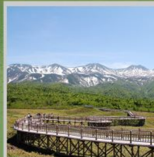
“SHIRETOKO 5 LAKES”