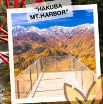
"HAKUBA MT. HARBOR"

วันเดินทาง 28 ต.ค. - 3 พ.ย. 2569 4 - 10, 11 - 17 พ.ย. 2569