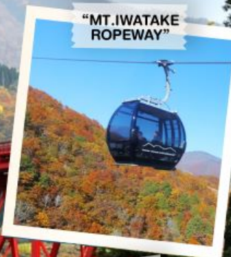
"MT. IWATAKE ROPEWAY"