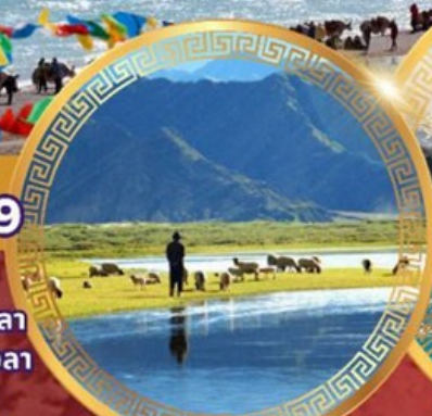
ทุ่งหญ้าทิเบตเหนือ ซางเป่ย์

ลานา พระราชวังโปตาลา วัดโจคัง ถนนแปดเหลี่ยม จุดชมวิวย่อเซ็กมัลลา ธารน้ำแข็งคาโรลา ชิคาเซ่ ช่องเขาจาชัวลา ถนน108โค้ง เอเวอเรสต์เบสแคมป์ วัดกาซิลุนโบ ทิวทัศน์แม่น้ำหยากลู่จางปู ทุ่งหญ้าทิเบตเหนือ ช่องเขานาเคนลา ทะเลสาบนาบูซัว