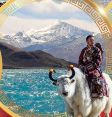
ทะเลสาบยิมดรีก