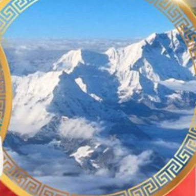
ห้าสุดยอดแห่งหิมาลัย