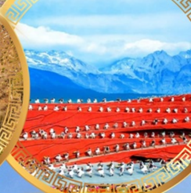
ความประทับใจแห่งลี่เจียง