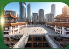
ตึกหุยซิง

อุทยานแห่งชาติหลุมฟ้าสะพานสวรรค์ ระเบียงกระจก อุทยานเขานางฟ้า ใต้เจียเซียง ห้างการ์เด็นควางหวน พระพุทธรูปแกะสลักหิน หมู่บ้านโบราณฉือชี่ไฉ่ ชมรถไฟฟ้าทะลุตึก ตึกหุยซิง ตึกตะเกียบ ถนนคนเดินเจียฟ้างเป๋ย ล่องเรือแม่น้ำแยงซีเกียงวิวคำคิน อิสระช้อปปิ้งหงหยาดัง