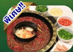
เมนูสุกี้หม่าล่า

พักโรงแรม 4 ดาว ★★★★★ ฟรี ประกันอุบัติเหตุ บริการ อาหารท้องถิ่น