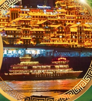
ล่องเรือแม่น้ำแยงซีเกียง

อุทยานแห่งชาติหลุมฟ้าสะพานสวรรค์ ระเบียงกระจก อุทยานเขานางฟ้า ใต้เจียเซียง ห้างการ์เด็นควางหวน พระพุทธรูปแกะสลักหิน หมู่บ้านโบราณฉือชี่ไฉ่ ชมรถไฟฟ้าทะลุตึก ตึกหุยซิง ตึกตะเกียบ ถนนคนเดินเจียฟ้างเป๋ย ล่องเรือแม่น้ำแยงซีเกียงวิวคำคิน อิสระช้อปปิ้งหงหยาดัง