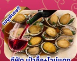
ซีฟู้ด เป้าอ้อ+ไวน์แดง