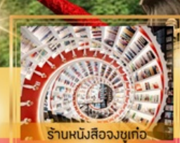
ร้านหนึ่งสี่องซูเก๋