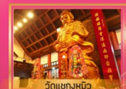
วัดเขงหมิว