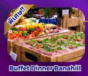
Buffet Dinner Banahill