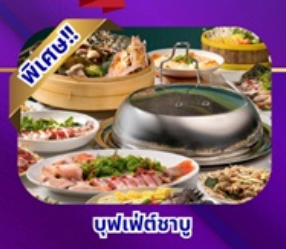
ซูฟฟีตชาบู