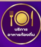
บริการอาหารท้องถิ่น