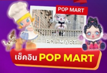
เช็คอิน POP MART