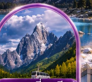
อุทยานสี่ดรุณี (รวมรถอุทยาน)