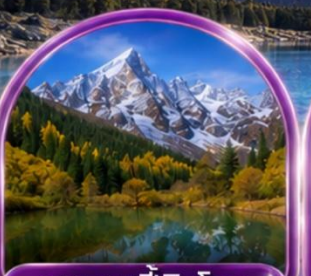
อุทยานปี้ผิงโกว (รวมรถกอล์ฟ)