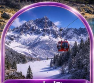
อุทยานต้ากู่ปิงชวณ (รวมรถอุทยาน+กระเช้า)

พิเศษ สุกี่หม่าล่า !! พร้อมน้ำจิ้มรสเด็ด