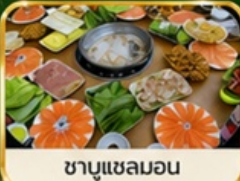
ชาบูแชลมอน