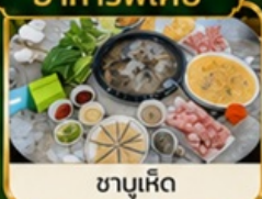
ชาบูเห็ด