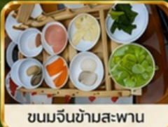
ขนมจีนข้ามสะพาน