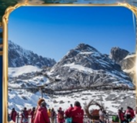
ภูเขาหิมะมังกรหยก +กระเช้าใหญ่