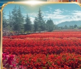
สวนดอกไม้ HUA YU MU CHANG