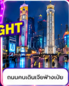
ถนนคนเดินเจียฟางเปี่ย