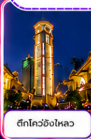
ตึกโควอชิงไหลว