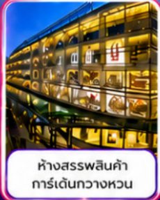
ห้างสรรพสินค้า การ์เด็นกวางหวน