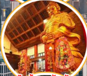
ไหว้พระวัดดัง