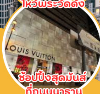
ช้อปปิ้งสุดมันส์ ที่ถนนนทราณ