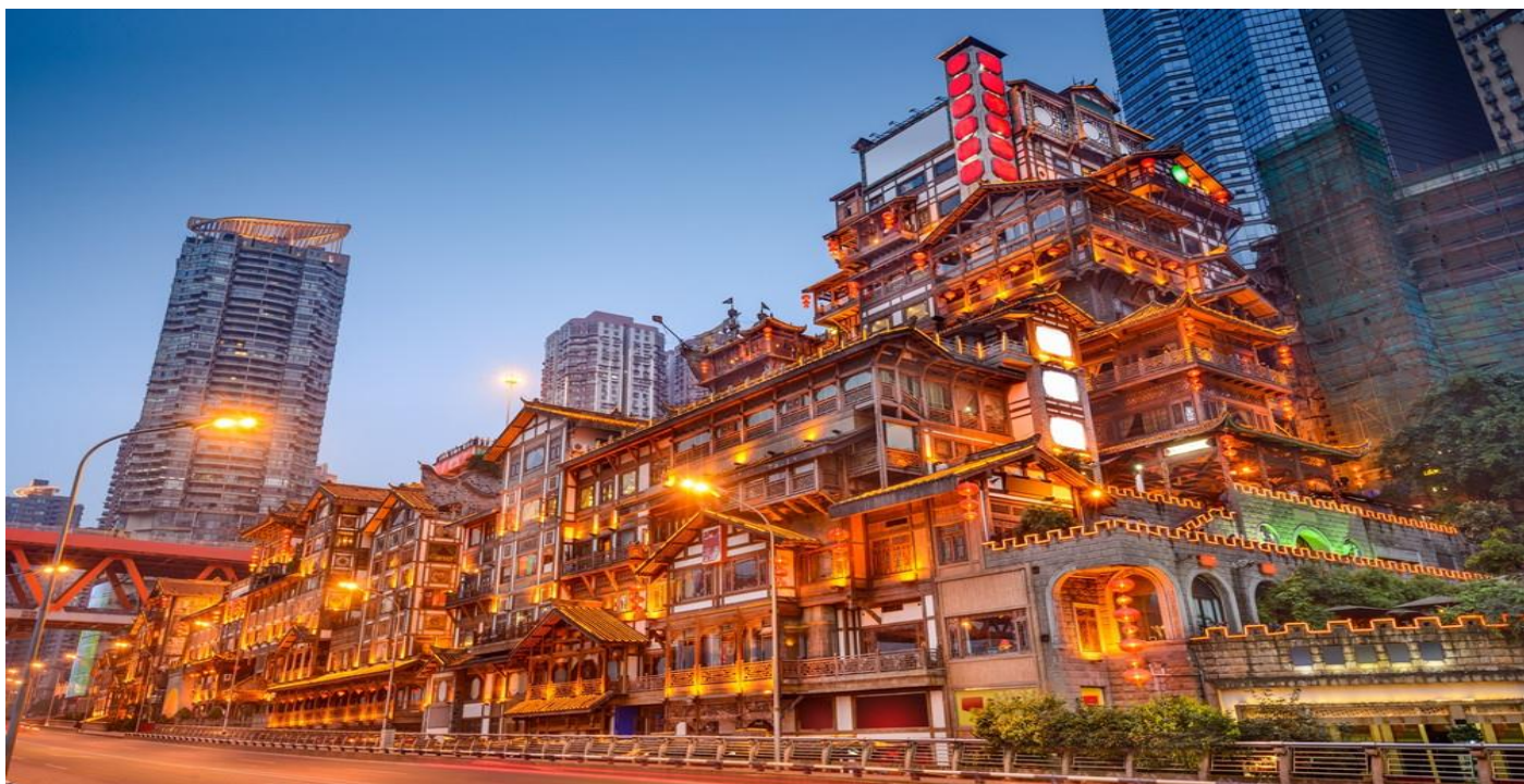
ที่พัก HOLIDAY INN EXPRESS หรือเทียบเท่าระดับ 4 ดาว

จุดชมวิวที่สามารถมองเห็นทิวทัศน์ของแม่น้ำเจียงหลิงและเมืองฉงชิ่งได้อย่างสวยงาม ยามค่ำคืนจะเต็มไปด้วยแสงไฟสีทองนวลที่ส่องสว่าง ทำให้ที่นี่มีบรรยากาศที่งดงามและโรแมนติกจนหลายคนเปรียบเทียบกับฉากในภาพยนตร์แอนิเมชัน Spirited Away อีกทั้งยังเป็นจุดถ่ายรูปที่สำคัญของนักท่องเที่ยวอีกด้วย