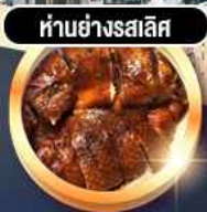
ห่านย่างสลีส