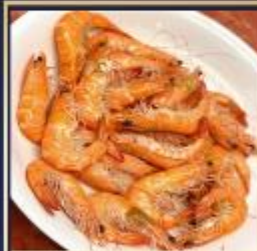
กุ้งหวานลวก