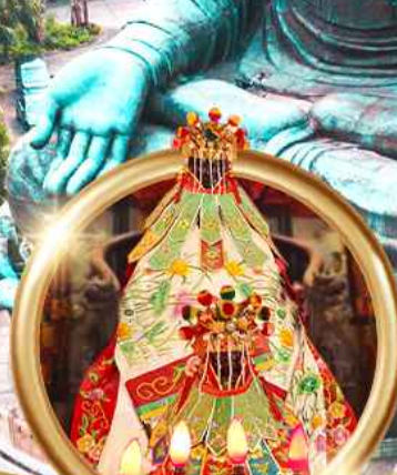
ยิมเงินเจ้าแม่กวนอิมสองฮ่า