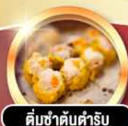
ติ่มช่าคั่นตำรับ