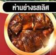
ห่านย่างสลีส