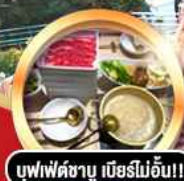
บุฟฟัตซาบู เมียรโมอัน!!