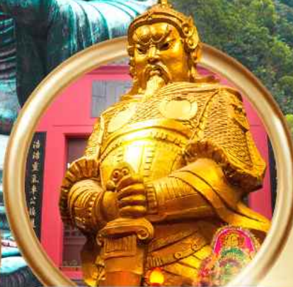
วัดชกงหมิว