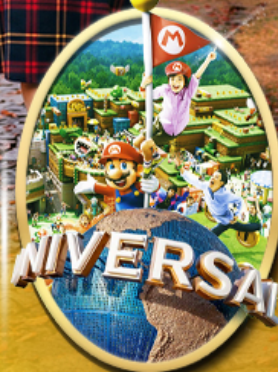
อิสระเลือกซื้อบัตร Universal Studios Japan

รหัสทัวร์ RJ-XJ140 เดินทาง 6D 4N 18 - 23 ต.ค. 69