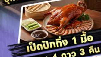
เปิดปีกทั้ง 1 มื้อ

พักรูม 4 ดาว 3 คืน ไฮไลท์ สุดว้าว! ขึ้นลิฟต์แก้วชมความอลังการ กลางหุบเขา