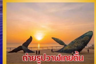
ต่ายรูปวาฬยักษ์ตื่น

สะพานจันเจียว-โบสถ์คาทอลิกชิงเต่า (ชมภายนอก)-ป่าตึกวน- พิพิธภัณฑ์เบียร์ชิงเต่า -ถนนคนเดินโตตง -ผิงไห่เก้อ-ชายหาดและ จุดต่ายรูปปลาวาฬยักษ์ตื่น -ถนนจ้าววีป่าเจีย-ชายหาดลากอเวย์ไห่- จัตุรัสซิงฟุเหมิน-สวนเว่ยไห่ -สวนเยวี่ไห่-เกาะหยางหม่าย่าน - เมือง เก่าเหยียนไถ่-ท่าเรือชาวประมงเหยียนไถ่-ภูเขาเหยียนไถ่-จัตุรัส 54 -ศูนย์ โอลิมปิกเรือใบชิงเต่า-ภูเขาเหลาซาน-วัดไท่ซิงกง-สวนเสี่ยวม่วยเต่า ชายหาดทะเลหมายเลข 3-อาคารไห่เทียน ชั้น 81- Cyber Punk