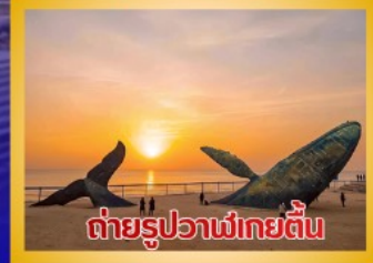
ต่ายรูปวาฬยกย่น

สะพานจันเจียว-โบสถ์คาทอลิกชิงเต่า (ชมภายนอก)-ป่าตึกวน- พิพิธภัณฑ์เบียร์ชิงเต่า -ถนนคนเดินโตตง -ผิงไห่เก้อ-ชายหาดและ จุดต่ายรูปปลาวาฬยกย่น -ถนนจ้าววีป่าเจีย-ชายหาดลากอวี่ไห่- จัตุรัสซิงฟุเหมิน-สวนเว่ยไห่ -สวนเยวี่ไห่-เกาะหยางหม่าย่าน - เมือง เก่าเหยียนไถ่-ท่าเรือชาวประมงเหยียนไถ่-ภูเขาเหยียนไถ่-จัตุรัส 54 -ศูนย์ โอลิมปิกเรือใบชิงเต่า-ภูเขาเหล่าซาน-วัดไท่ซิงกง-สวนเสี่ยวม่วยเต่า ชายหาดทะเลหมายเลข 3-อาคารไห่เทียน ชั้น 81- Cyber Punk