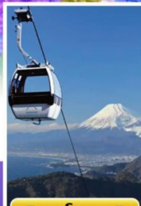
อิซุพาโนรามาริว