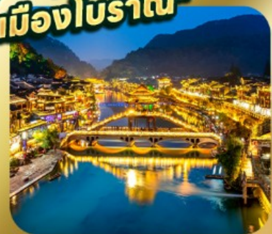
"เมืองโบราณเฟิ่งหวง"