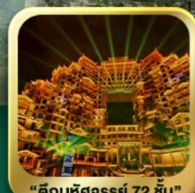
"ตึกมหัศจรรย์ 72 ชั้น"

นั่งกระเช้าชมภูเขาเทียนเหมินซาน • กำประตูลิ่ว • ทางเดินกระจก เมืองโบราณเฟิ่งหวง • เมืองโบราณฟูหลงเจิน • ชมโชว์จิ้งจอกขาว ภูเขาเทียนจื่อซาน (รวมลิฟต์แก้ว) • หุบเขาอวตาร • ตึกมหัศจรรย์ 72 ชั้น