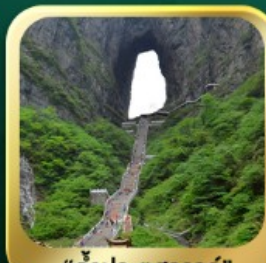
"กำประตูลิ่ว"