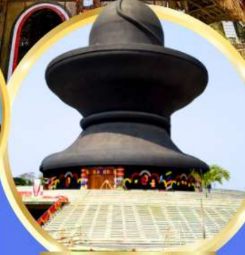
วัมมหาฤตยูชัย