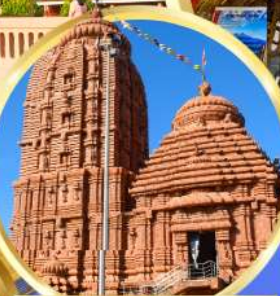
เทวาลัยศรีจักรนารท แห่งดีบุรกาห์