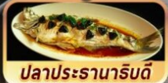
ปลาประจักษ์ริบตี