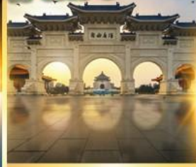
อนุสรณ์เจียงไคเชก