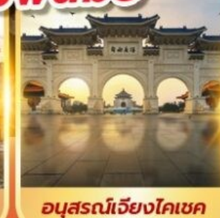
อนุสรณ์เจียงโตเซค