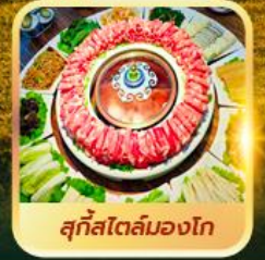
สุกีสโตล์มองโก