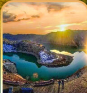
หุบเขาแม่น้ำฮวงเหอ