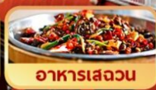
อาหารเสววน