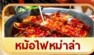
หม้อไฟหม่าล่า